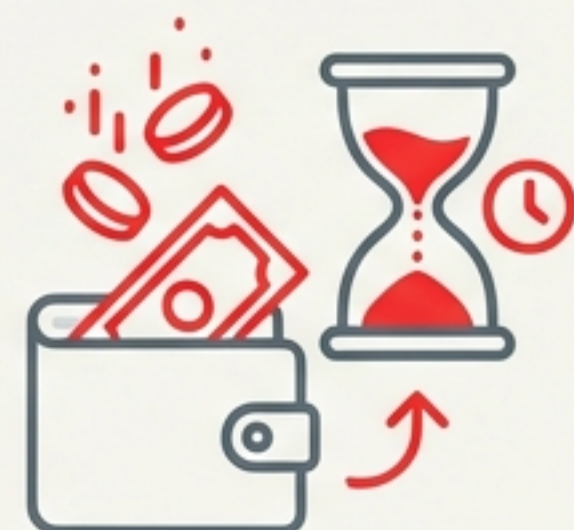
Kosten: Sprit, Zeit, Nerven

Forschungsfrage: Kann ein smartes System, das Tempo und Ampeln automatisch anpasst, in deutschen Städten funktionieren – und lohnt es sich?