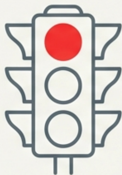
Starre Ampeln & Limits